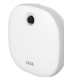
NEW 동작감시 센서기

사용중 표시기 동작감시 센서기 : 97 x 97, T26.4 사용중 표시기 : 93.5 x 93.5, T16