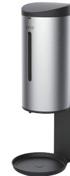
NEW TA160Y-1(액상, 트레이) TA161Y-1(거품, 트레이)