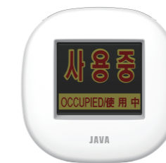
NEW 사용중 표시기 (동작감시 센서기)